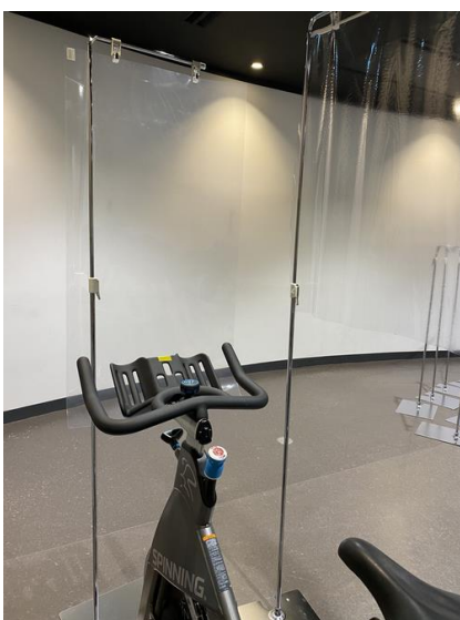
■バイク:2方向をビニールシートで保護